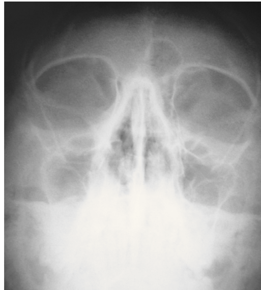
Fig. 1 – Radiografia dos seios perinasais: agenesia do seio frontal direito

O estudo na consulta de alergologia concluiu alergia para o pêlo de cão, sem outras. Serologia para VIH 1/2 e Aspergillus (ABPA) negativas; doseamento de– IgA 383 mg/dl, IgG 1050 mg/dl, IgM 40 mg/dl, kappa 172