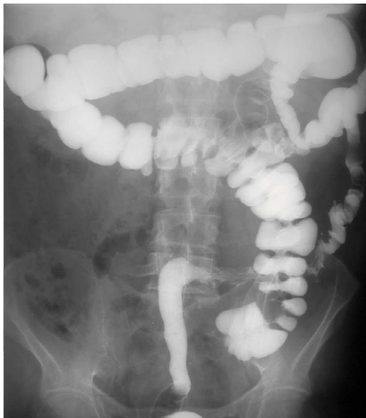
Fig. 3 – Clister opaco: malrotação intestinal com cego na fossa ilíaca esquerda.

mografia computadorizada torácica – bronquiectasias cilíndricas dispersas nos lobos inferiores; ecocardiograma – dilatação e hipertrofia do ventrículo esquerdo; clister opaco – malrotação intestinal, o cego e o cólon ascendente apresentam-se localizados na fos-