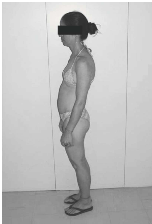
Fig. 1 – Fotografia da doente em perfil

desdobramento e hiperfonese de segunda bulha em foco pulmonar e sopro sistólico de ++/6 em focos tricúspide e aórtico acessório. Aparelho respiratório: intensa dispneia em repouso, uso de musculatura acessória e tiragem intercostal; à auscultação, murmúrio vesicular audível diminuído globalmente, sem ruídos adventícios. Abdómen: fígado era palpável a 6 cm do rebordo costal direito e em epigástrio levemente doloroso. Nos membros inferiores observava-se edema +++/4 bilateralmente depressível e sem sinais flogísticos. Diante da gravidade do quadro, a doente foi internada. Os exames complementares mostraram: