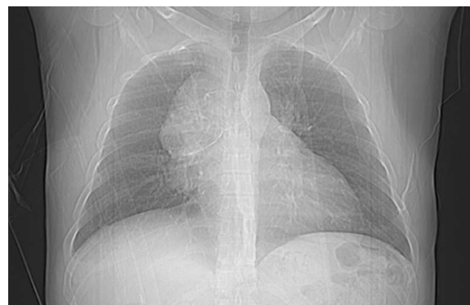
Fig. 1 – Radiografia do tórax: Massa do mediastino anterior. Sem outras alterações pleuroparenquimatosas

-pélvico por tomografia computadorizada e a ecografia testicular não revelaram alterações. O doente foi posteriormente submetido a toracotomia (pelo 4.º EID, presença de massa mediastínica fixa, com componente central duro-elástico) com realização de biópsia incisional do tumor, tendo o estudo histopatológico (Fig. 3) revelado uma neoplasia de células grandes, de núcleos vesicu-