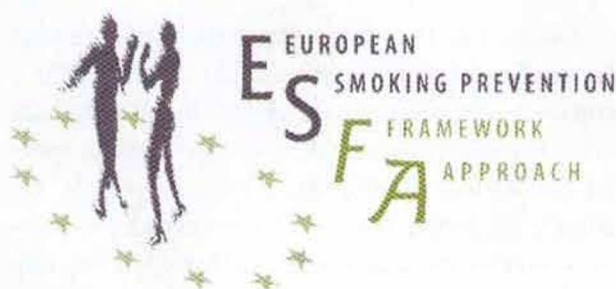
Fig. 2 – Logo do Projecto ESFA