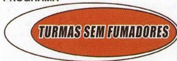
Fig. 3 – Logo do Programa "Turmas Sem Fumadores"