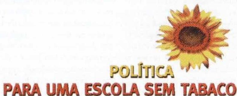
Fig. 4 – Logo do Programa "Política para uma Escola Sem Tabaco"

Com o fim de implementar a "Política para uma Escola Sem Tabaco" foi realizado um inquérito à comunidade escolar cujos resultados foram apresentados numa newsletter amplamente distribuída no início do ano lectivo 1999/2000. Ao mesmo tempo foi editado um cartaz, uma carta foi entregue a professores e funcionários, uma versão reduzida dessa carta foi lida em todas as turmas da escola, foi afixado um painel à entrada da escola para anunciar uma "Escola Sem Tabaco", foram afixados dísticos de proibido fumar e foram realizadas outras acções de sensibilização da comunidade escolar.