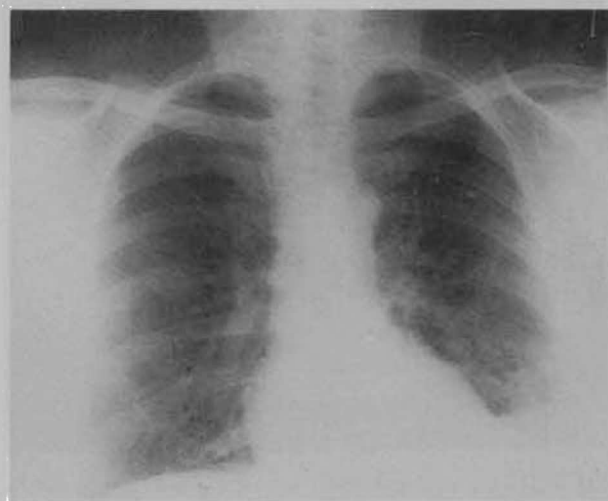
Fig.1 - Radiografia com imagens areolares a nível do lobo inferior esquerdo

A radiografia do tórax revelou a presença de opacidades heterogêneas, imagens areolares, um caso de atelectasia e outro de consolidação (Fig. 1). O diagnóstico das bronquiectasias foi confirmado pela tomografia axial computadorizada em 21 doentes (80,7%) dos 26 que realizaram este exame (Fig. 2). Destes, 10 fizeram conjuntamente broncografia, havendo concordância das lesões em 8 casos (80%). Nos casos em que esta não se verificou, um deles apresentava em TAC, imagens retracteis associadas com bronquiectasias varicosas localizadas no LIÉ e de difícil definição na grafia e num outro em que a TAC apresentava bronquiectasias no