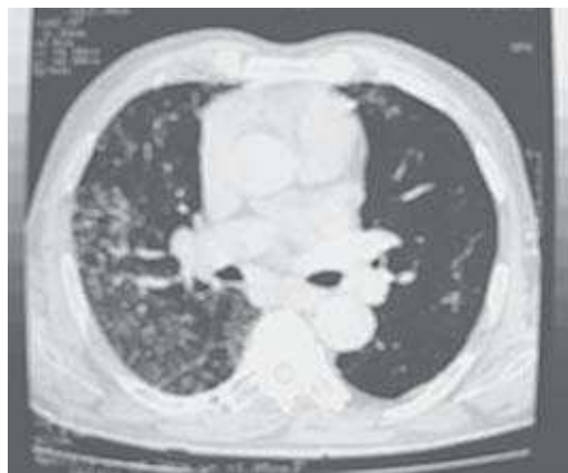
Fig. 2 – TC torácica (14-3-2002)

Fez provas funcionais respiratórias que mostraram difusão alveolo capilar de CO diminuída.