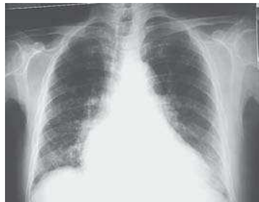
Fig. 4 – Telerradiografia torácica (31-10-2003)

Nas consultas de follow-up de pneumologia tem-se mantido assintomático do foro respiratório.