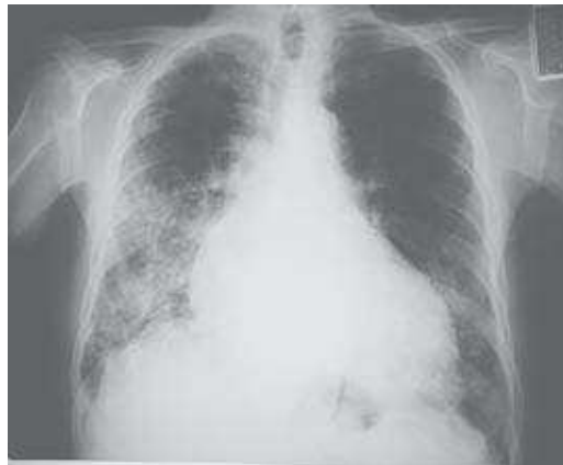
Fig. 1 – Telerradiografia torácica (26-2-2002)

Era portador dos seguintes exames realizados em ambulatório: Telerradiografia do tórax (Fig. 1) – “... padrão retículo-nodular difuso, predominando no pulmão direito, com zonas em favo-de-mel; nas regiões superiores com bolhas enfisematosas e/ou bronquiectasias... fibrose intersticial?” e TAC torácica (Fig. 2) – “... fibrose intersticial, com opacidades em vidro despolido dispersas, mais nos andares médios e inferiores à direita... com alteração da arquitectura do parênquima pulmonar, em particular nas bases...”. Foram colocadas as hipóteses de diagnóstico de fibrose pulmonar – secundária à amiodarona?, idiopática? ou tuberculose pulmonar. Analiticamente com hemograma e bioquímica normais, VS- 34 mm (N<20 mm), ECA normal e marcadores tumorais normais. Z-N e cultural em Lowstein da expectoração negativos. Gasimetria arterial sem alterações (pH-7,42; pO 2 -84,6 mmHg; pCO 2 -38,8 mmHg; HCO 3 -24,6 mmol/L; Sat O 2 -97%). ECG com fibrilhação auricular, frequência cardíaca de +/- 72 bpm, alteração da repolarização ventricular.