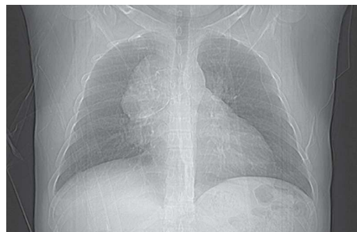
Fig. 1 – Radiografia do tórax: Massa do mediastino anterior. Sem outras alterações pleuroparenquimatosas

-pélvico por tomografia computadorizada e a ecografia testicular não revelaram alterações. O doente foi posteriormente submetido a toracotomia (pelo 4.º EID, presença de massa mediastínica fixa, com componente central duro-elástico) com realização de biópsia incisional do tumor, tendo o estudo histopatológico (Fig. 3) revelado uma neoplasia de células grandes, de núcleos vesicu-