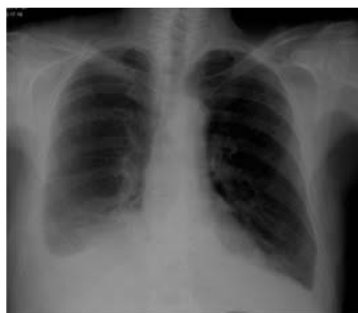
Fig. 5 – Telerradiografia de tórax pós-talcagem– hipotransparência homogênea de concavidade superior na base do hemitórax direito e obliteração do fundo-de-saco costofrénico esquerdo