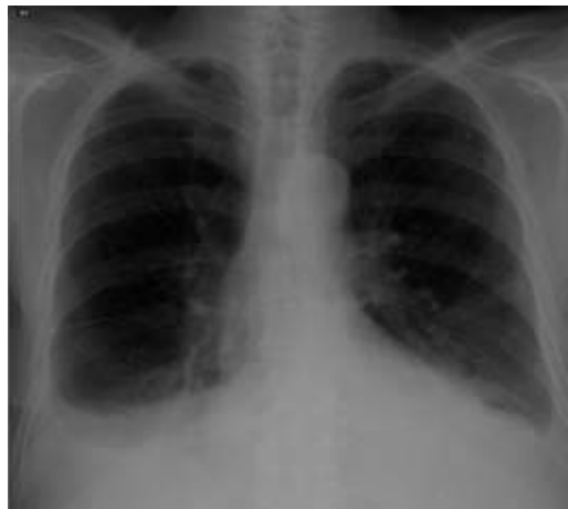
Fig. 7 – Radiografia do tórax à data da alta. Apagamento de ambos os fundos-de-saco costofrénicos, mais acentuado no hemitórax direito

causa de quilotórax é o trauma 5,6 , podendo surgir após traumatismo fechado ou penetrante. A ruptura do ducto torácico pode acontecer após um acesso de tosse ou vômito 7 . Actualmente, a maioria dos casos de quilotórax traumáticos surgem após procedimentos cirúrgicos envolvendo o coração, pulmão, cirurgia da cabeça e/ou pescoço. A lesão pode ocorrer inclusive após técnicas toracoscópicas. A incidência global de quilotórax após cirurgia torácica ronda 0,5 % 7 . Na série de Shimizu e colaboradores, a incidência foi de 2,4 % após a realização de 1110 lobectomias e pneumectomias, com ressecção sistemática dos gânglios mediastínicos 8 .