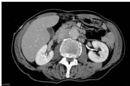
Fig. 2 – Aglomerado adenopático retrocruiral e retroperitoneal

Foi submetido a biópsia aspirativa de gânglio axilar e posteriormente a exérese, sendo diagnosticado linfoma não Hodgkin B da zona marginal (Fig. 3). Iniciou ciclo de quimioterapia com CVP (ciclofosfamida, vincristina, prednisona). Por persistência de derrame pleural direito, efectuou toracosopia e pleurodese com talco (Fig. 4), com boa resposta clínica e radiológica (Fig. 5). O doente teve alta mantendo tratamento com dieta pobre em triglicéridos de cadeia longa e quimioterapia. Por aparecimento de derrame pleural à esquerda com as mesmas características bio-