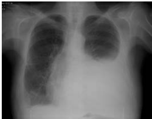
Fig. 6 – Hipotransparência homogénea de concavidade superior na metade inferior do hemitórax esquerdo