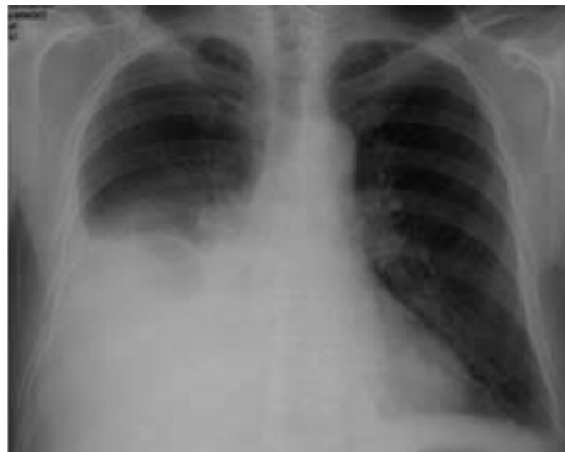
Fig. 1 – Hipotransparência homogénea na metade inferior do hemitórax direito

cosas coradas e hidratadas, sem icterícia ou cianose. Presença de adenopatia axilar esquerda de aproximadamente 1,5 cm de diâmetro. Tórax simétrico com macicez à percussão e abolição do murmúrio vesicular na metade inferior do hemitórax direito. Auscultação cardíaca normal. Abdómen e membros sem alterações. O estudo efectuado no serviço de urgência mostrou: hemoglobina 15 g/dl; leucócitos 15850/ \mu l (neutrófilos 88%; linfócitos 8%); função renal e ionograma normais; DHL 280 U/L; proteínas totais 7,7 g/dl; PCR 15 mg/dl. Na gasimetria arterial (FiO 2 21%) apresentava pH 7,45; PaCO 2 42,7 mmHg; PaO 2 : 70 mmHg; HCO 3 - 29,6 mmol/l; SatO 2 : 93 %. A telerradiografia PA de tórax revelou hipotransparência homogénea na metade inferior do hemitórax direito sugestiva de derrame pleural (Fig. 1). Realizou toracocentese diagnóstica, com saída de líquido purulento e cheiro fétido. O estudo citológico e bioquímico do líquido pleural apresentava características de empiema. Foi colocado dreno torácico e iniciada antibioterapia com piperacilina-tazobactam + amicacina. Os estudos anatomopatológicos e bacteriológicos do líquido pleural foram negativos.