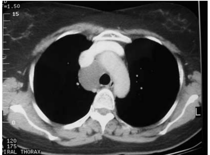
Fig. 2 – Tomografia de tórax pré-operatória – lesão mediastino paratraqueal direita, homogênea, com densidade de partes moles e sem realce ao contraste, sem invasão de estruturas adjacentes

Face à necessidade de afastar-se a rara possibilidade de metástase mediastínica isolada de um tumor ovariano ou outra neoplasia primária, como um linfoma, foi realizada uma mediastinoscopia cervical. Durante o procedimento, encontrou-se uma lesão de paredes finas e conteúdo líquido cristalino, que levantou a suspeita intraoperatória de tratar de um linfangioma cístico. No mesmo procedimento anestésico realizou-se abordagem cirúrgica por toracotomia direita com preservação muscular visando a res-