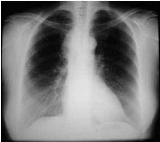
Fig. 1 – Rx tórax pré-operatório – lesão mediastínica paratraqueal direita com densidade de partes moles, sugerindo aumento de nódulo linfático hilar

minais, sendo ambas as lesões achados incidentais de exames de imagem.